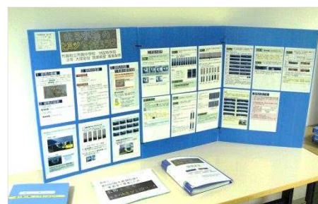
【中学校の部 知事賞受賞作品】