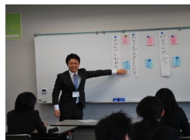
昨年度の様子「教科指導の実際」