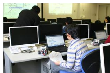
昨年度の様子 「プログラムでロボットを動かそう」