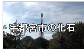
最優秀賞（「宇都宮市の化石」）

本コンクールへの各応募作品は、4月から栃木県視聴覚ライブラリー（総合教育センター内）で貸し出します。また、3月18日（金）の11時15分から、栃木県庁1階ガイダンスビジョンにおいて、入賞作品の上映会を行います。各作品の上映予定時刻は、以下のホームページから確認できます。