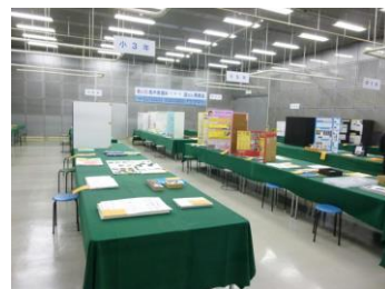
展覧会（栃木県子ども総合科学館）

→Click! http://www.tochigi-edu.ed.jp/center/tenrankai/h27-rikakenkyu/tenrankai.htm