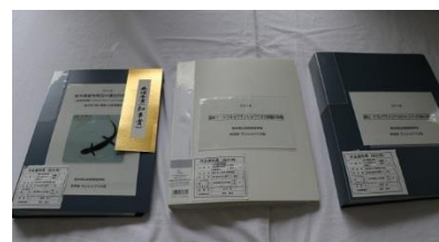
高校の部 最優秀賞（知事賞） 「栃木県産有尾目の遺伝的多様性 2」

→Click! http://www.tochigi-edu.ed.jp/center/tenrankai/h30-kagakusho/tenrankai.htm