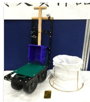
金賞受賞作品 「おたすけ土のう隊、出動！」

なお、今年度金賞を受賞した作品は、当センターの Web サイトで公開しています。