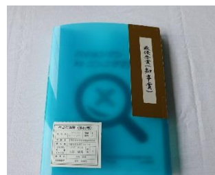
中学の部 最優秀賞（知事賞） 「バイキンマン vs ニンニクマン」

なお、今年度の本審査に出品された作品は、今後、当センターの Web サイトで 12 月中に公開する予定です。