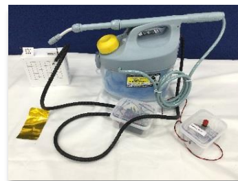
金賞受賞作品 「クーラークーラー」

→Click! http://www.tochigi-edu.ed.jp/center/tenrankai/h30-hatsumeiki/kinsyo.htm