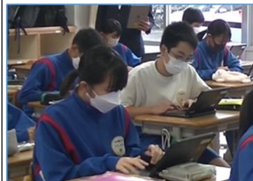
学習活動④ 振り返りシート(Excel)に入力する。