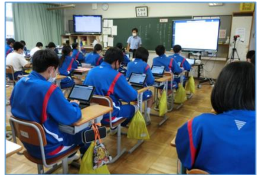
学習活動② 構成メモを基に、意見文を書く。 (Excelで作成したワークシートを用いて書く。)