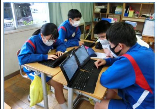
学習活動① 2人目以降のコメントについてタブレット上で読み合い、意見を交わす。