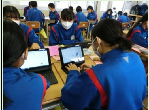
学習活動② タブレット内にあるワークシートを見ながら話し合う。