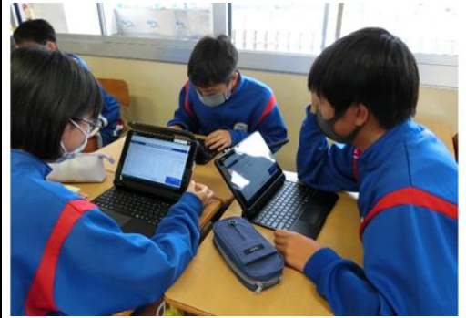
学習活動② 班内で、それぞれの根拠が適切かを吟味し合い、Excelのコメント機能を用いて入力し、意見を交わす。