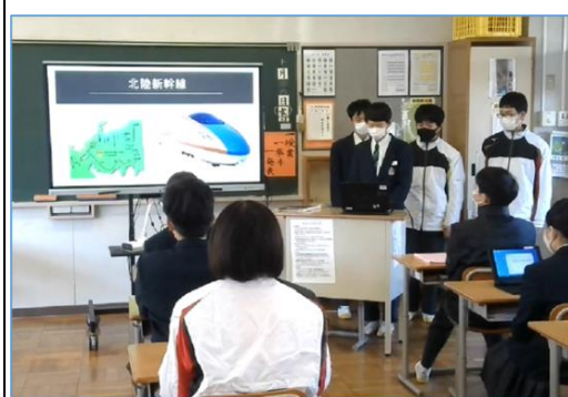
学習活動③ 「修学旅行先のプレゼン」の様子。