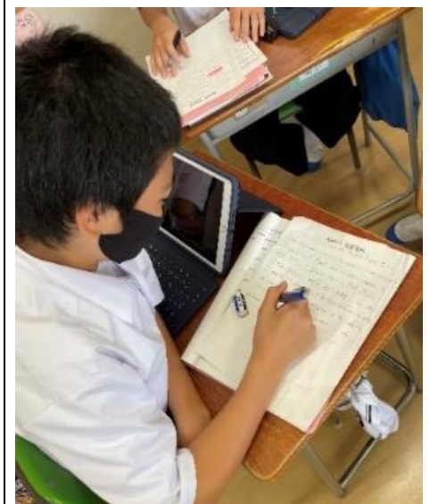
学習活動④ 発表原稿の完成に向けた修正