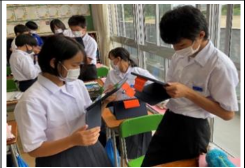
学習活動② 英語表現の確認