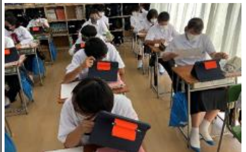
学習活動② 発表動画の視聴（個人）