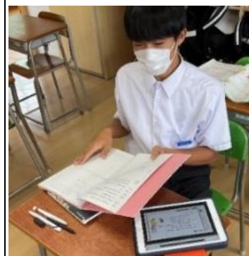
学習活動④ 発表原稿の再構築