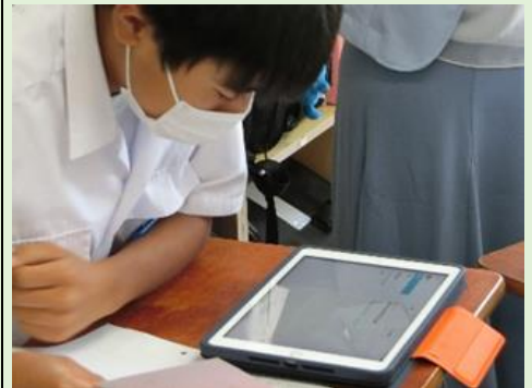
学習活動③ 翻訳アプリを用いた発音の確認