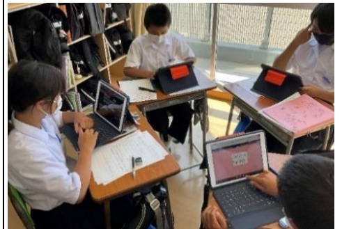
学習活動⑤ お互いの英文を参照