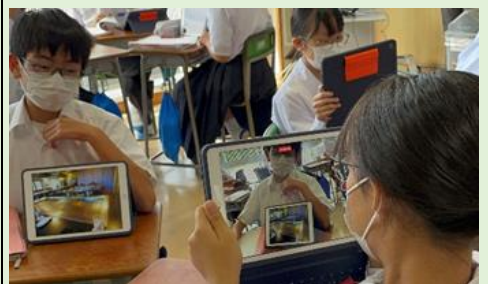
学習活動④ グループ内で発表