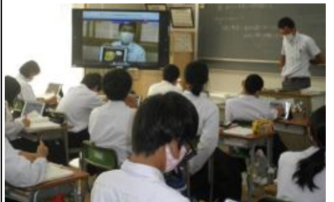
学習活動④ 発表動画の視聴（全体）