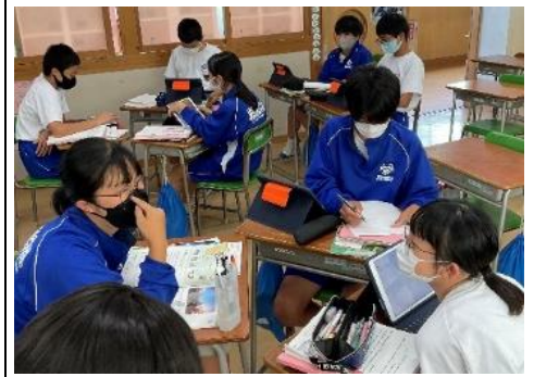
学習活動⑤ 再構築した英文を相互に参照している様子