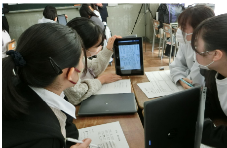
タブレットを用いて新聞記事の内容を発表している様子

この時間は、ワールドカフェ方式でメンバーの入れ替えを行いながら、作成した新聞記事を用いて発表したり、他のグループの発表を聞き、それに対する質疑応答をしたりする時間を設定した。その後、聞き取った内容を自グループで共有し、それを基に、「世界各国の政治や社会は、第一次世界大戦の前後でどのように変化したのだろうか?」という問い(学習課題)に対する自分の考えをまとめる展開で進めた。