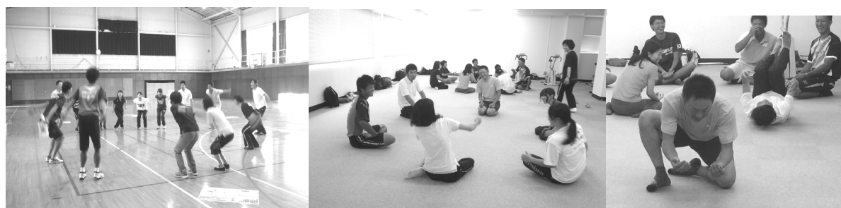
①皆で息を合わせて、リーダーの合図で跳ぶ

注) 本講座の内容は、院生や内留生とともに行った教材開発や、全国授業研究グループ並びに各種ボディ・ワークでの講習内容をアレンジし、様々な教育現場等での実践を踏まえて、有効であったものについて紹介した。