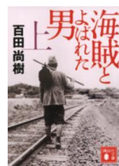
海賊とよばれた男 「海賊とよばれた男」