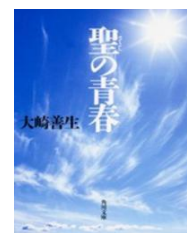
聖の青春 「聖の青春」