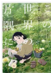
この世界の片隅に 「この世界の片隅に」