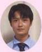
七井中学校出身 1年生

クラスが楽しく充実した学校生活を送ることができています。先生方も優しく、明るく指導して下さいます。部活動では先輩・後輩の仲が良く、日々目標に向かって努力しています。