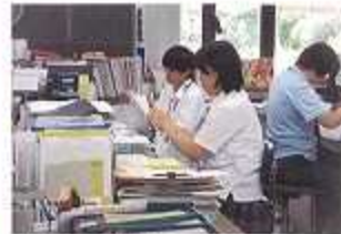
インターンシップ