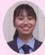
市貝中学校出身 1年生

クラスが楽しく充実した学校生活を送ることができています。先生方も優しく、明るく指導して下さいます。部活動では先輩・後輩の仲が良く、日々目標に向かって努力しています。