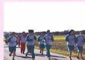
校内マラソン大会