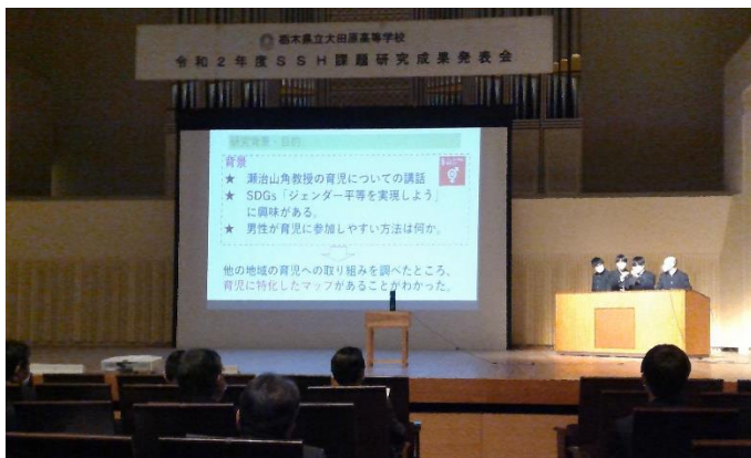
〈最優秀賞「大田原市育児マップを作ろう」の発表風景〉

最優秀賞は「大田原市育児マップを作ろう」、優秀賞は「適切な湿度をつくる」、「音楽と勉強の関係性」となりました。おめでとうございます。