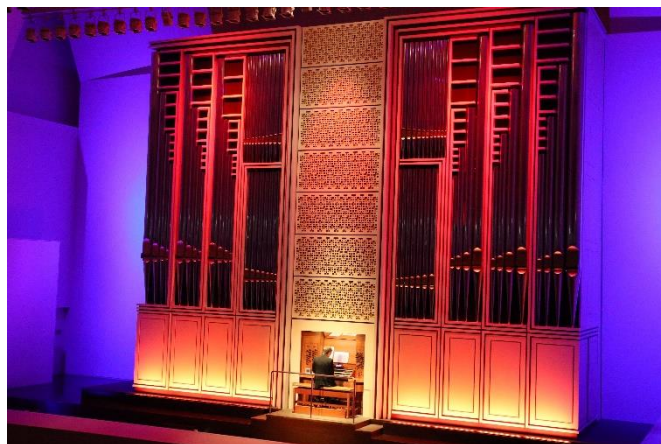
<パイプオルガンリサイタル ジャン=フィリップ・メルカート氏>