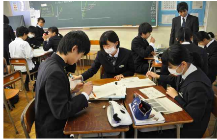
中3-2 : 数学 (基礎)