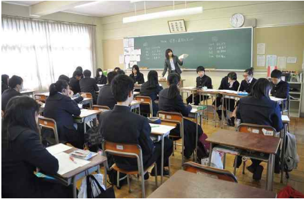
高1-4 : CTP