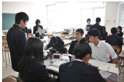
高2-1：英語コミュニケーションⅡ