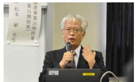
松本先生による指導助言