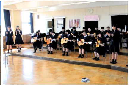
高1-3 : 音楽