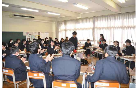
高1-3 : CTP