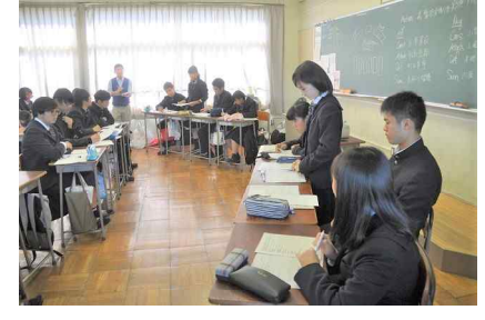
高1-2 : CTP