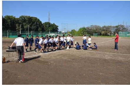
中1-3 : 体育