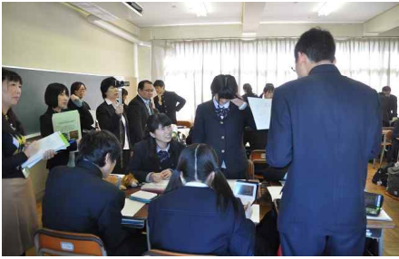
高1-1 : CTP