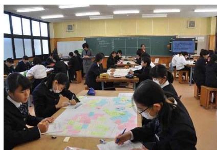
中1-1：技術家庭（技術分野）