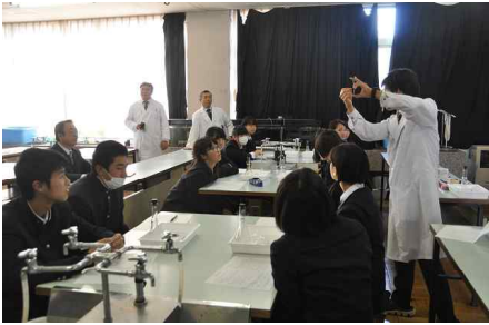
高2-3 : 生物