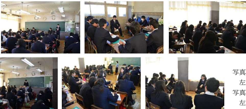
体験発表会の様子 写真上 左から2年1組・2組・3組 写真下 左から2年4組・5組・6組