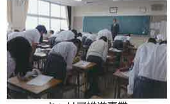
キャリア推進事業