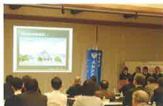
プロポーザルたかこう