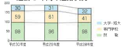
過去3年間の進路状況

栃木県立衛生福祉大学校(2) 栃木県県南高等看護専門学校 栃木県農業大学校 栃木県立県央産業技術専門学校(3) 宇都宮ビジネス電子専門学校(4) IFC調理師専門学校(3) IFC栄養専門学校 IFC製菓専門学校 宇都宮歯科衛生士専門学校(2) 宇都宮メディア・アーツ専門学校 大原簿記情報ビジネス医療福祉専門学校(4) 大原スポーツ公務員専門学校(4) 国際情報ビジネス専門学校(2) 国際看護介護保育専門学校(2) 国際ファッションビューティ専門学校(2) 国際テクニカル美容専門学校 国際調理製菓専門学校 国際テクニカルデザイン・自動車専門学校 国際テクニカル美容専門学校 国際医療福祉大学塩谷看護専門学校 済生会宇都宮病院看護学校 マロニエ医療福祉専門学校 小山歯科衛生士専門学校(2) 中央アートスクール(2) 栃木県美容専門学校 報徳看護専門学校(2) 宇都宮准看護高等専修学校(2) 専門学校ヒコ・みづのジュエリーカレッジ つくば国際ペット専門学校 大宮ビューティーアート専門学校 埼玉ベルエポック製菓調理専門学校 JAPANサッカーカレッジ 国際デュアルビジネス専門学校 大宮医療秘書専門学校 日本工学院専門学校 専門学校ビジョナリーアーツ 専門学校医学アカデミー