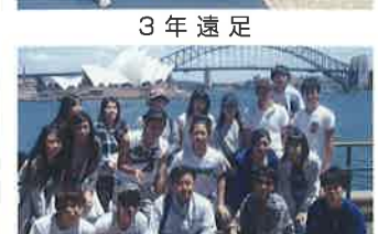
海外研修(オーストラリア)