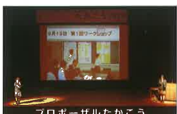
プロポーザルたかこう