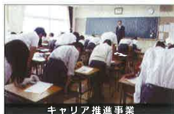
キャリア推進事業