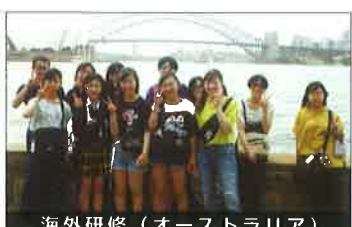
海外研修(オーストラリア)