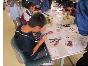
写真 4 サイエンススクール

10 月 14 日市内小学生対象のサイエンススクールが開催されました。内容は、スカイベリージャムの製作と、それを使ったプログラミング講座です。私たちは、この講座全体の運営を行いました。