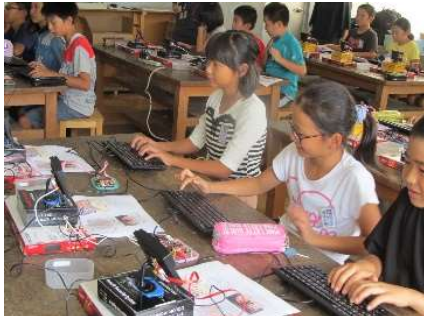
写真 3 出前授業風景

今年度、私たちは、活動の中心をプログラミング出前講座としました。学校周辺の小中学校に案内状を送り、希望した学校へ出向き、プログラムを教えるという活動