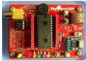
写真 1 こどもぼそこん SkyBerryJAM

昨年の先輩方は、小学校でプログラミングの授業が必修になることを知り、プログラミングの学習やものづくりの教材また昔を懐かしむ「レトロパソコン」としてなど、そのパソコンボードを商品化できないかと考え、平成 28 年度企業家精神育成事業（県教育委員会）に応募さまざまな活動の中で試作・改良を繰り返し、完成させたのがプログラミング専用パソコン「SkyBerryJAM」です。