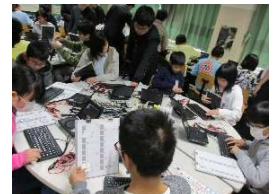
写真 6 講座風景

1 月 13 日、日鉄日立システムエンジニアリング(株)からの協力依頼があり、東京都葛飾区立末広小学校にて初のコラボ＆初の県外でのプログラミング出前講座を実施しました。