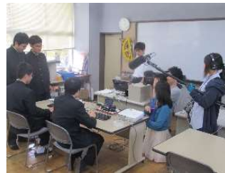
写真 5 NHK の取材の様子

私たちのこの活動について NHK 宇都宮から取材協力の依頼がありました。数日に渡り、校内での活動やスカイベリージャムの紹介、そして出前講座について小学校現地での撮影がありました。そして関東地方向けに NHKTV のニュース等で 11 月～12 月にかけて 3 度放映されました。