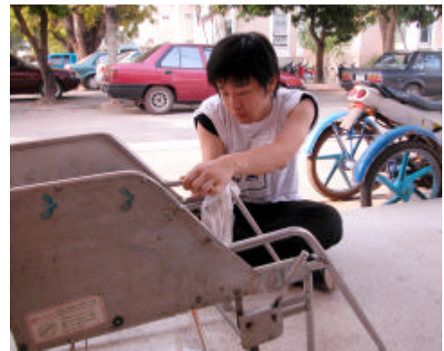
修理作業に没頭する筆者

何かに惹きつけられるかのように、いつの間にか修理の輪の中にいた。カメラをブラシに、ペンをレンチに持ちかえて車いすを囲んでいた。私は“17人目”の高校生になった気分、さび落としに夢中になった。彼らと共に、手を真っ黒にしながら修理する喜びを感じることができたのは、何よりの収穫だった。車いすの前では、生徒と教師の関係はなく、一人の技術者としての付き合いだけ。日本人とタイ人の間には国境はなく、一人の人間としての付き合いだけ。タイボラは現地の人々との交流のきっかけになっているのは言うまでもないが、校長室、職員室の壁を越え、教師と生徒が同じ目線で同じ体験を共有できる素晴らしさがあると感じた。共に笑い、意見を交わし、技術を競い、時には直接不満をぶつける。本来あるべき教育現場の姿でありながら、現代において次第に失われつつあることではないだろうか。