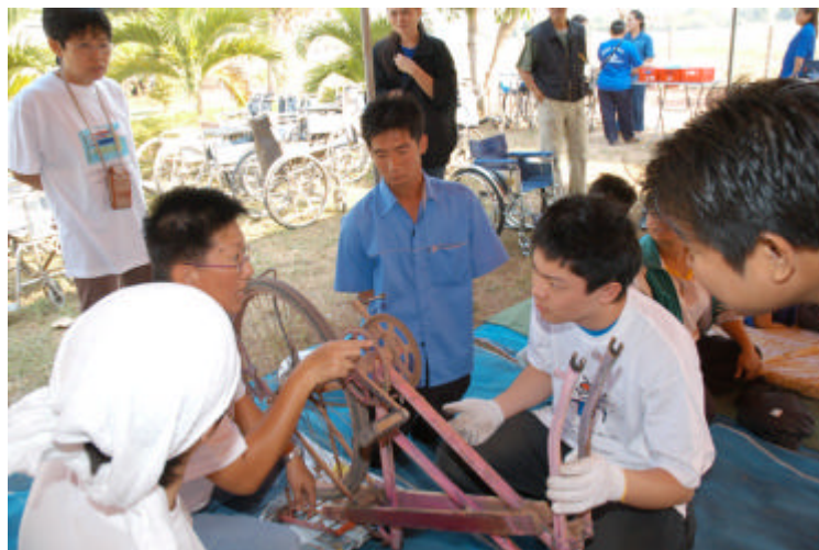
修理活動風景(ピッサヌローク県庁舎にて)

ng Mee School)、ピッサヌローク県庁舎(Pitsanu lok Office)