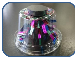
きらきらボックス