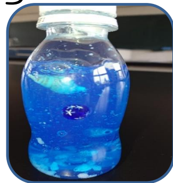
スライムでセンソリーボトル