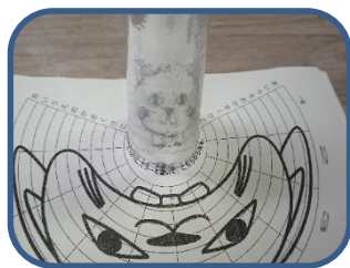
アナモルフォーシス