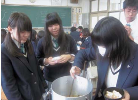
給食当番が「なつかし〜♡」