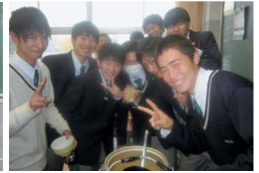
これで表紙は決まり!!