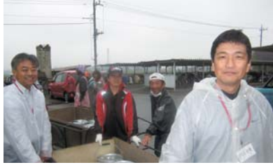
リヤカーでみんなの元へ！