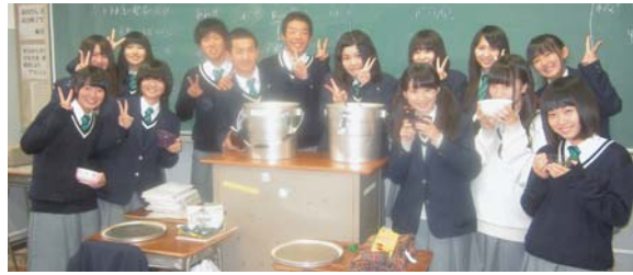
皆で仲良く♡ハイポーズ