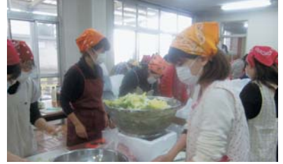
大量の野菜をみんなで切る作業