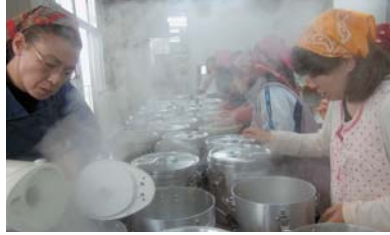
冷えきったズンドウを温める