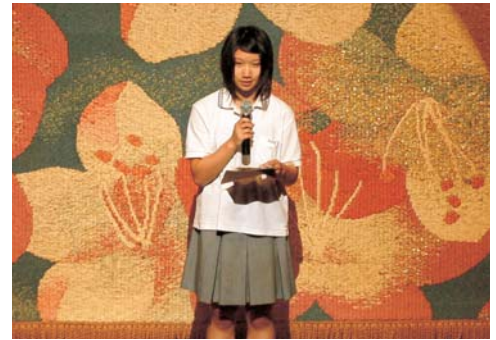
開会・閉会のことば