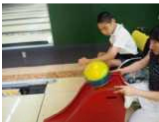
中学部校外学習「ボウリング活動」