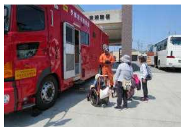
ほしブロック校外学習「消防署見学」