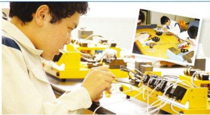
チャレンジできる資格 ● 第2種電気工事士、工事担任者DD3種、危険物取扱者など

電気・電子の広く一般的な理論と技術を学びます。電気回路、屋内配線、プログラミング、ロボット制御などです。授業で学んだことを実習の授業で実験や製作を通してその内容の理解を深めます。