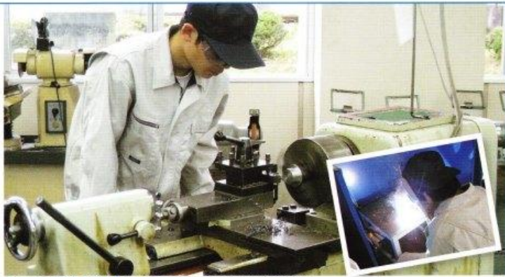
チャレンジできる資格 ● 2級ボイラ技士、3級技能士(旋盤加工)、ガス溶接技能講習、危険物取扱者、製図検定など

旋盤などによる機械加工、ガス・アーク溶接等の基礎技術を身につけ、3年次にはロボットや電気自動車などグループで様々なテーマに意欲的に取り組んでいます。機械科は、ものづくりの楽しさを実感できる科です。