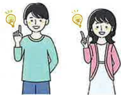
多種多様な作業があります