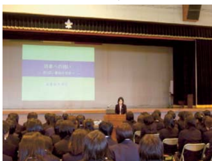
第1学年合同のオリエンテーション

また、同校は、平成20年度に文部科学省のSSH(スーパーサイエンスハイスクール事業)研究指定(5年間)を受け、学校設定教科・科目、高大連携、課題研究などに取り組んでいます。これらの学習活動を効果的に展開するため、数年続けていたブックトークなどの読書を中心とした指導から、以前行っていた情報探索の演習を中心とした指導に切り替えました。