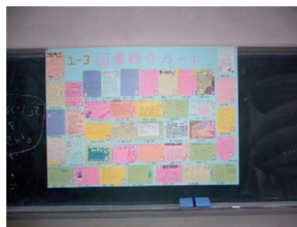
教室に掲示した本の紹介カード (宇女高)