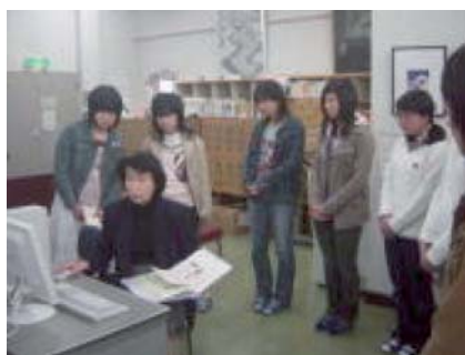
クラスごとのオリエンテーション