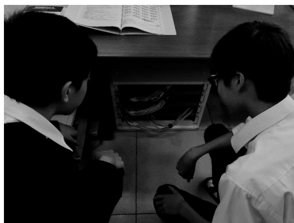
図2 ネットワーク機器の確認