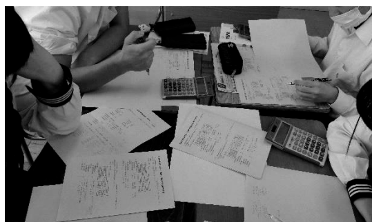
図1 グループでの考察