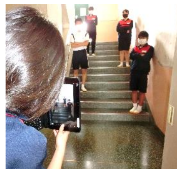
【学習活動3】 主題に適した表現方法を試す。