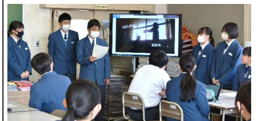
【学習活動2】 作品についての発表の様子