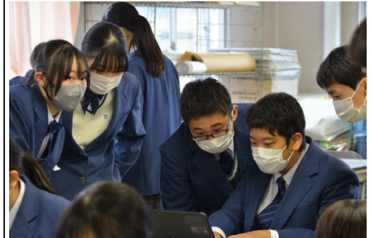
【学習活動3】 主題に迫るために、班で意見を出し合いながら写真に加工を施す。