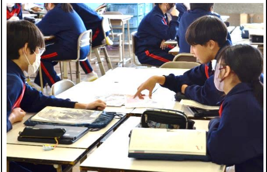
[学習活動3] 写真を用いた作品を基に、効果的な表現方法について意見交換をする。