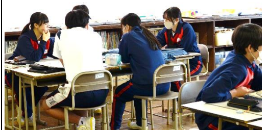
[学習活動3] 作品の主題について話し合う。