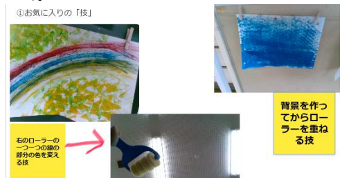
【学習活動5】 見付けた「技」を写真と共に振り返ることができる。