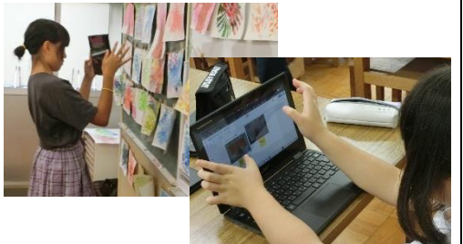
【学習活動4】 自分が見付けた「技」や友達の作品から見付けた「技」を写真で記録していく。