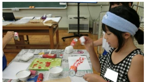
【学習活動3】 友達と教え合い、試しながら「技」について交流する。