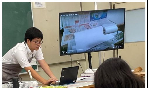
【学習活動2】 演示を動画で行うことで、製作時間が確保されるとともに、児童がタブレットを活用して何度も見ることができる。