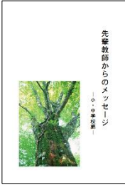
「先輩教師からのメッセージ」 （小・中学校編） 平成 19（2007）年 11 月

本冊子の内容につきましては、これまで作成しました「先輩教師からのメッセージ―小・中学校編―（平成十九年度）」「先輩教師からのメッセージ―高等学校・特別支援学校編―（平成二十年度）」「先輩教師からのメッセージⅡ（平成二十六年年度）」とあわせて、栃木県総合教育センターのWebサイトよりダウンロード可能です。