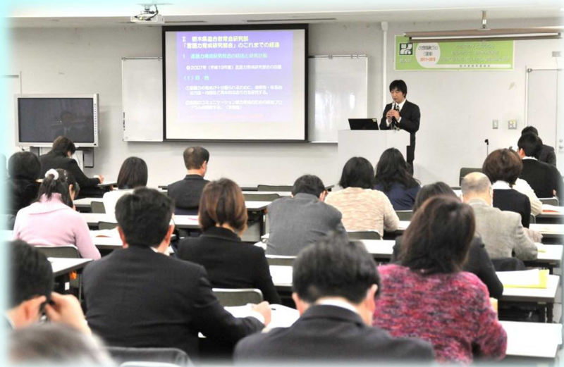
〔言語活動の充実部会〕 発表の様子

発表校では教職員の人間関係が構築されていると思いました。校内で研修を進める際のリーダーシップとフォローシップの大切さを感じました。