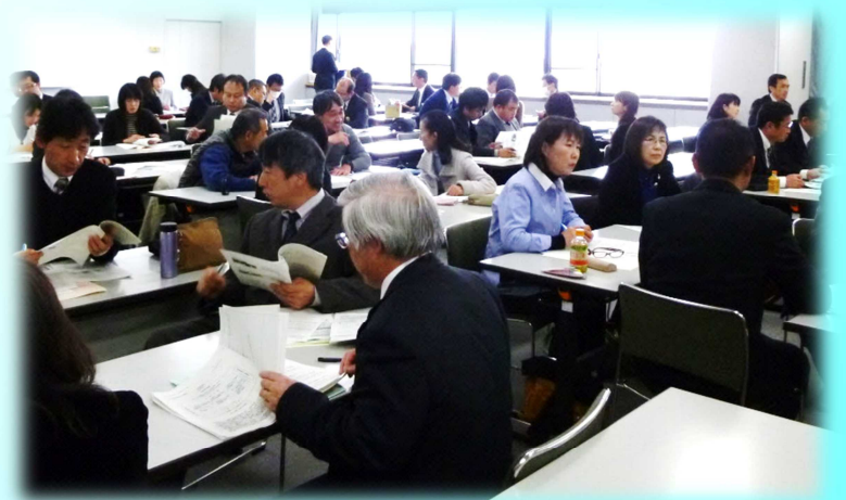
〔人権教育部会〕 研究協議の様子