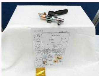
「安心安全などこでも皮膚治療器」