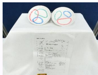
「みてわかる計量皿」