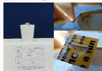
「トランスフォーマーティーバッグ」