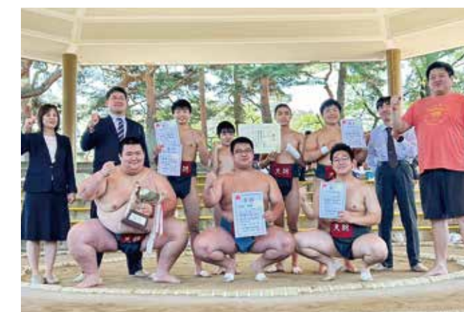
相撲部 ★16連覇★ 県総体兼関東予選相撲大会 団体 優勝(2024年度)

※バスケットボール部、バレーボール部、サッカー部、華道部、手芸部、音楽部(吹奏楽)、ボランティア部は令和7年度より新規部員の募集を停止します。