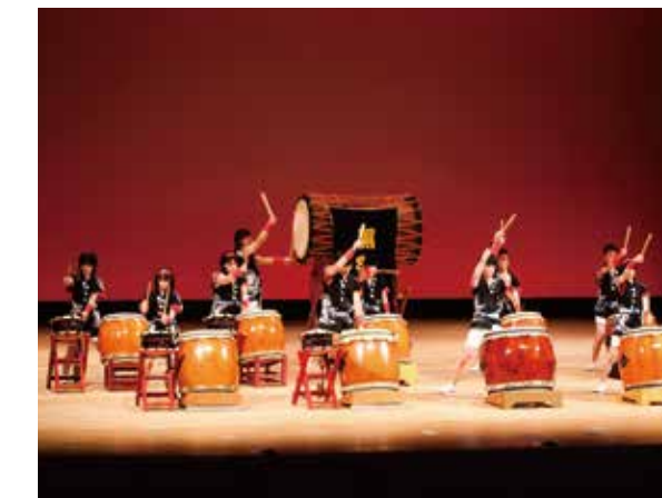
黒羽太鼓部 第46回全国高等学校総合文化祭 郷土芸能部門出場