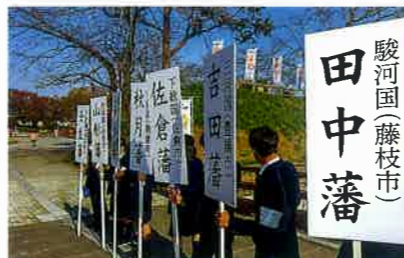
藩校サミットでのボランティア