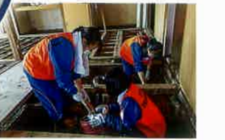
災害ボランティア