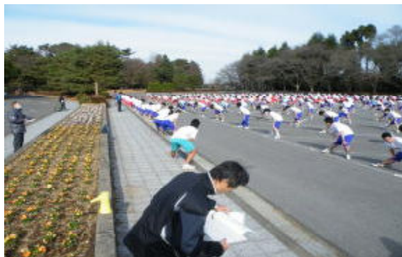
《スタートを前に準備運動をする生徒達》

12月15日（火）真岡市の井頭公園にて、第50 回校内マラソン大会が行われました