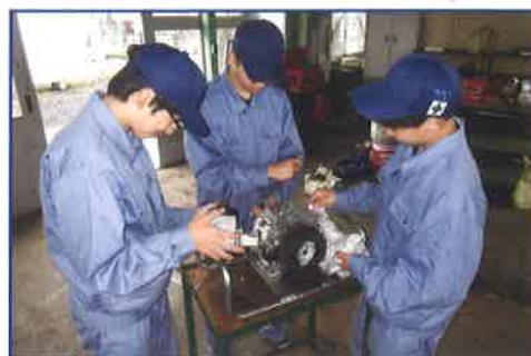
原動機 内燃機関(エンジン)の分解・組立作業を行います。構造や各部位の役割を学びます。自動車整備の基本的な内容も学習します。

土木や建築に関する基礎的・基本的な知識と技術を習得させ、福祉や環境にも配慮することのできる思いやりの姿勢を備えた実践的な資質・能力を有する建設技術者を育成する。