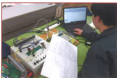
自動制御 有接点リレーシーケンス制御およびPLC制御の機器を使用して、機械制御の概要と基本的操作を学習します。

電子や情報に関する基礎的・基本的な知識と技術を習得させ、情報化社会に対応できる新たな電子技術や情報ネットワーク技術等にも積極的に挑戦する態度を備えた実践的な資質・能力を有する電子技術者を育成する。