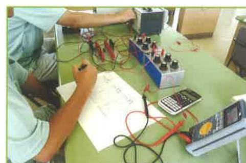
OPアンプ 増幅回路(音響機器)や制御回路などに利用されているOPアンプ(演算増幅器)の入出力特性や周波数特性について学習します。