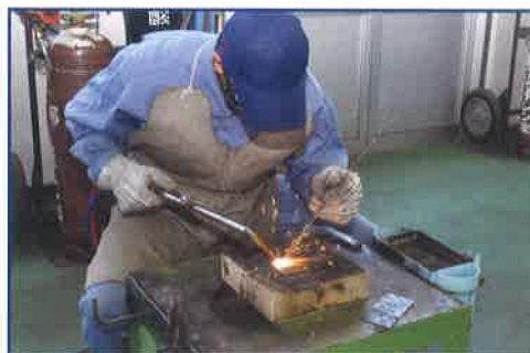
溶接作業 ガス、アーク(電気)を用いた溶接作業を行います。3年生では、技術コンクール溶接部門にもチャレンジします。