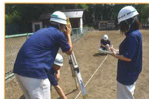
測量 測量機器を用いて、地面の高さや2点間の距離・角度を測定し、土地の形状や面積などを求める技術を学びます。