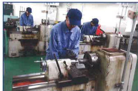
機械加工 旋盤・フライス盤・ホブ盤・マシニングセンタ等の様々な工作機械を使用して機械加工の基礎的・基本的な技術を習得します。