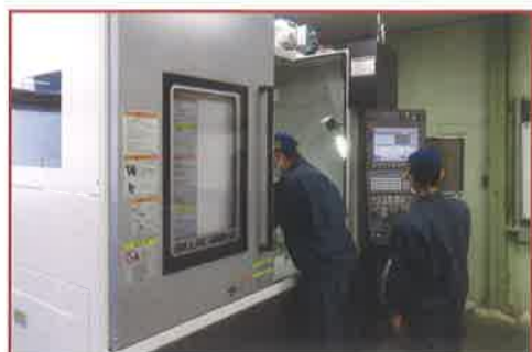
マシニングセンタ マシニングセンタを動作させるための基本的な座標の取り方やプログラミングについて学習し、プレート等の加工を行います。