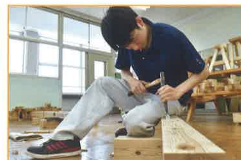
木材加工 家具の製作や木の組み方などを通して、鋸(のこぎり)や鑿(のみ)、鉋(かんな)の使い方や木材の加工技術を学びます。