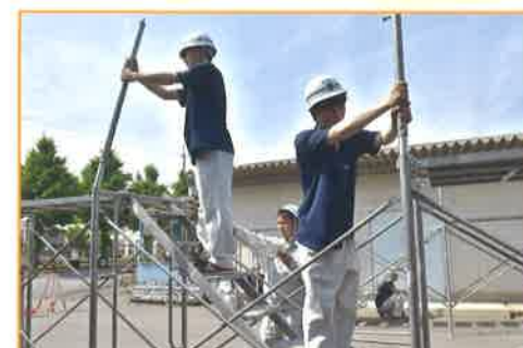
施工 鉄筋組立や足場組立など建設現場に即した実習を通して、作業手順や安全な作業方法を学びます。