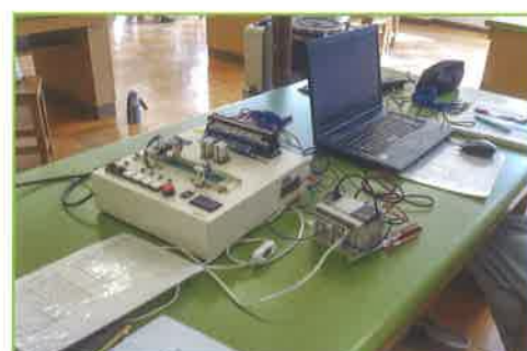
PLC制御 パソコンを使い、ラダー図(制御図)をもとにプログラミングし、ランプやモーターなどの制御について学習します。