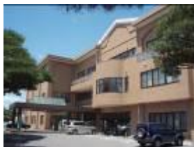
いきいきふれあいセンター