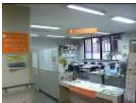
ボランティアセンター