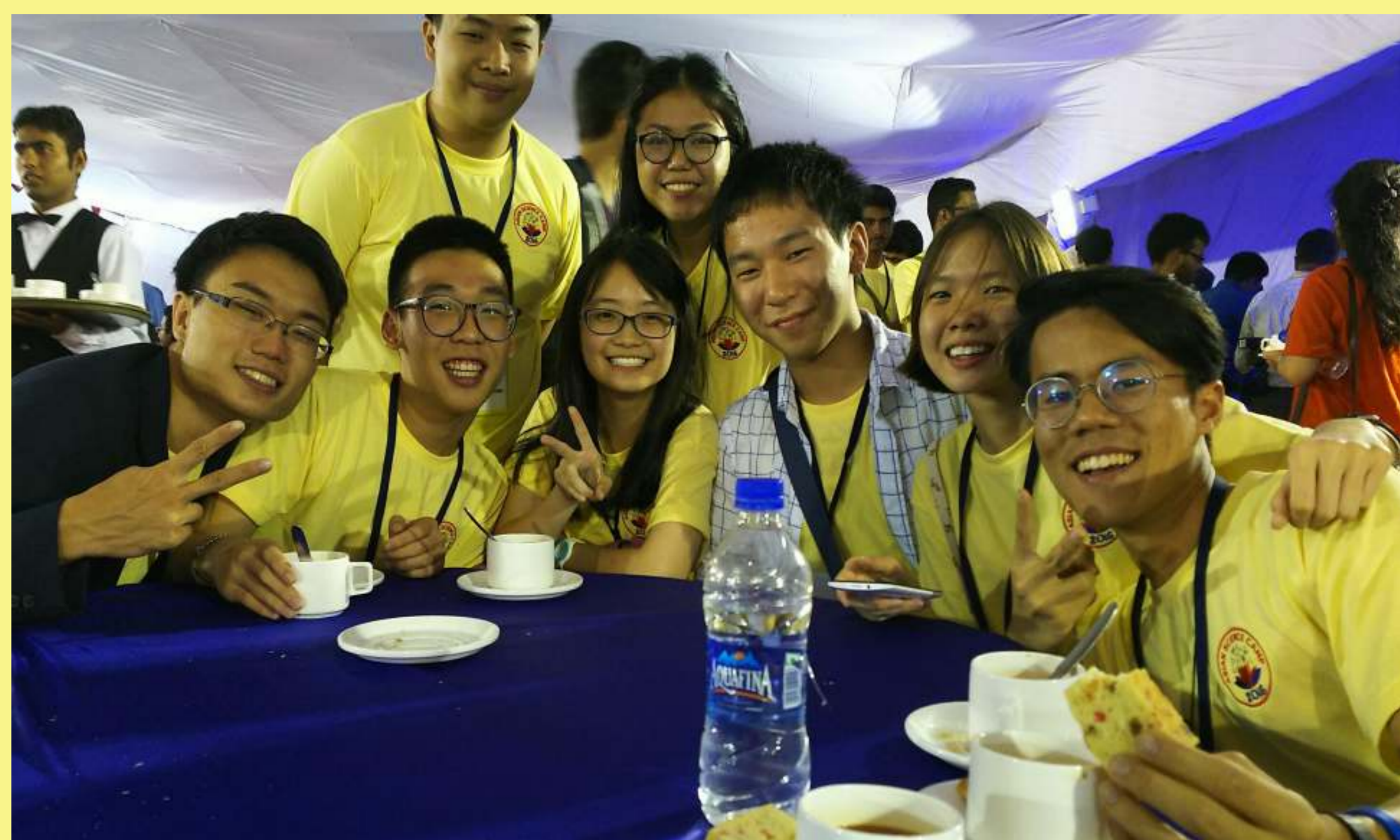
【Fig.5】 タイ代表派遣団の皆さんと

High Teaは、サンドイッチなどの軽食やお菓子とともに紅茶を楽しむというイギリス発祥の習慣で、このキャンプでは1日あたり2回ほど催された。もともとインドはイギリスの植民地であったため(事実上)、このような習慣が残っているのだそうだ。私は、インドをはじめとするアジア各国の代表派遣団の皆さんと、お茶と会話を楽しんだ。特にタイ代表派遣団の皆さん(Fig.5)と仲良くなり、「ドラゴンボール」や「ドラえもん」などの日本のアニメの話をしたり、お互いの国の観光名所や見どころなどを紹介し合ったりした。タイなどの東南アジア地域でも日本のアニメは人気らしく、アニメで覚えたと思われる「じゃあな！」などの日本語のくだけた挨拶を積極的にしてくれた。