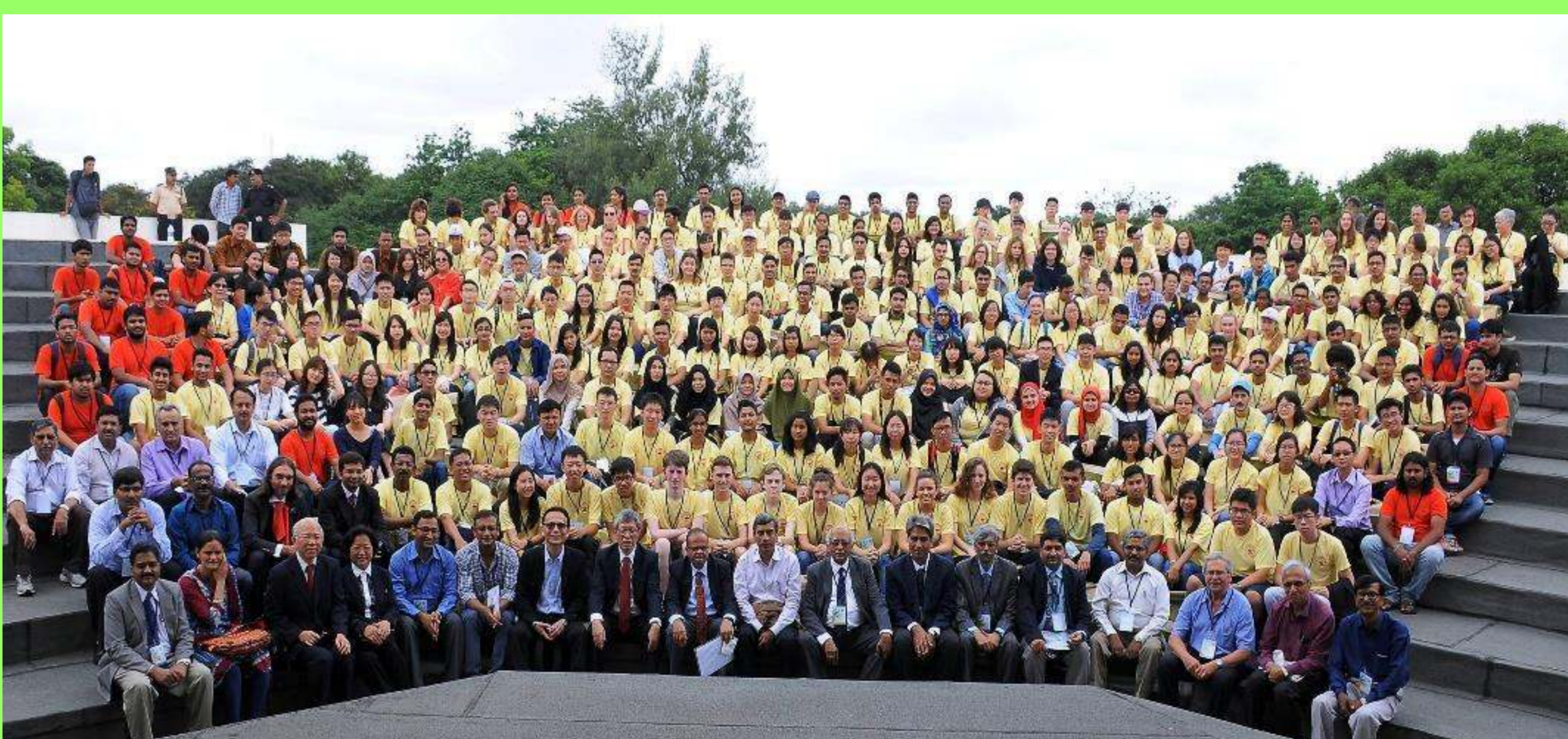
【Fig.1】 キャンプ参加者集合写真

「アジアサイエンスキャンプ2016(Asian Science Camp 2016)」は、平成28年8月21日から27日にかけて、インド南部の都市バンガロール(「インドのシリコンバレー」と称される、インド第3の巨大な経済都市)で開催された。アジアサイエンスキャンプは、ノーベル賞受賞者や世界のトップレベルの研究者による講演会や、講演者がリードするディスカッションセッションなどにより、科学の面白さを体験して生徒同士の交流を深める国際的な科学技術合宿である。10回目となったインド大会には、23の国や地域から、約220名の学生・生徒が参加した。日本からは、厳しい審査を経て選ばれた19名(高校生15名、高専生1名、大学生3名)が参加した。