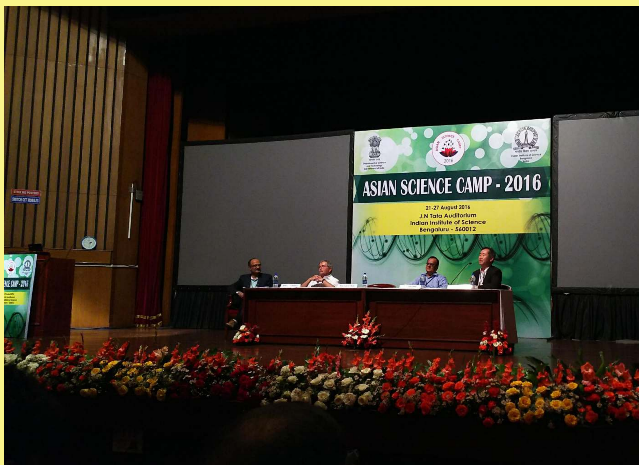
【Fig.4】 Interactive Sessionの様子

また、オーストラリアからの参加者から提起された、「女性科学者は、男性科学者と比べると圧倒的に人数が少ない」というトピックに対しては、セッション参加者から素晴らしい問題提起だという称賛の声が上がった。