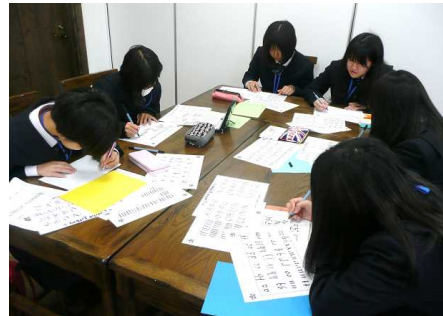
カリグラフィーの様子