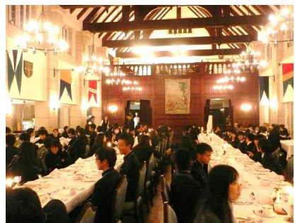
豪華ディナーで実践