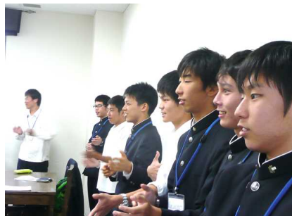
ゲームを通じて英語に親しむ