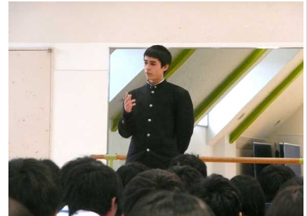
ファイナリストのスピーチ②