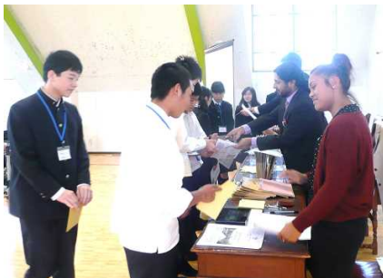
英語でチェックイン

ブリティッシュヒルズ内での活動中は、常に英語を使用します。初日は英語でチェックインの手続きをするところから始まりました。講義はゲームなどを通じて自然に英語が発せられるように工夫されており、生徒は楽しみながら取り組んでいました。買い物にはブリティッシュヒルズ専用の紙幣を用い、英語を駆使してお菓子などを購入しました。