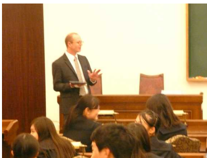
講義の様子 in English

英語でテーブルマナーの講習を受け、紳士的なイギリス文化について学び、グリーンピースを用いてナイフとフォークの使い方等を学びました。グリーンピースが苦手な生徒は、必死になって近くの生徒に譲っていましたが…。最後に場所を移動し、豪華ディナーをいただきました。生徒は少し緊張しながら慣れない手付きで食事をしていました。