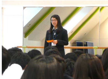
ファイナリストのスピーチ①