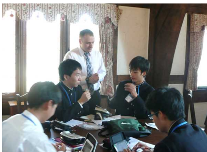
スピーチスキルトレーニング中

講座の中で、語彙力の高め方や表現のしかたを学び、スピーチスキルを身に付けました。生徒は、考えを相手に伝える難しさや、伝わったときの喜びを味わっていました。最終日閉会式前には、講座グループの中でスピーチスキル1位の生徒が、全生徒の前でスピーチをしました。生徒の一生懸命な姿や高いスピーチ力に、驚かされました。