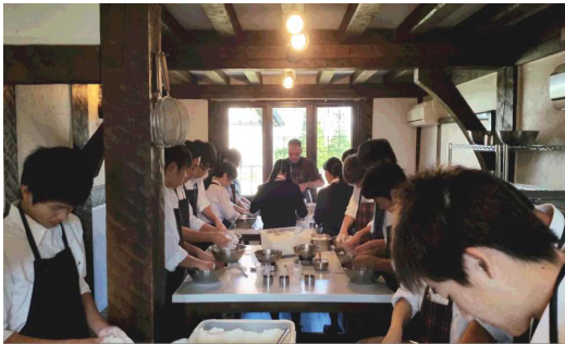
スコーン作りの様子

選択講座では、スコーン作りやカリグラフィー等を行いました。スコーン作りでは、英語での指示に従い、的確に作業を進めました。生徒たちは上手にできて笑顔を見せていました。カリグラフィーでは、文字を美しく見せる手法を学び、見栄えの良い手紙などを作成しました。素晴らしい手づくり作品を完成させました。