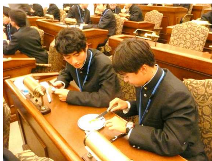
グリーンピースで実践