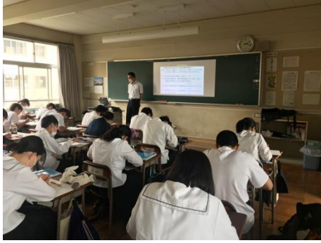
CTP 授業風景 (他の3クラスへ配信中)