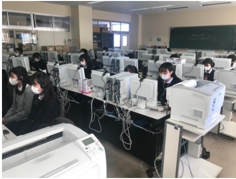
高校生フォーラム FOCUS