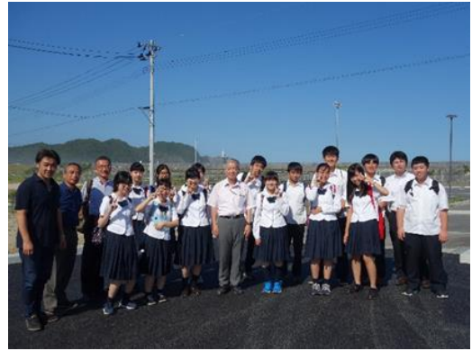
～研究員の感想（抜粋）～

研修全体を通し、事前研修ではわからなかった様々な現実に触れ、今後の新たな研究課題をつかむことができたことが最大の収穫となりました。