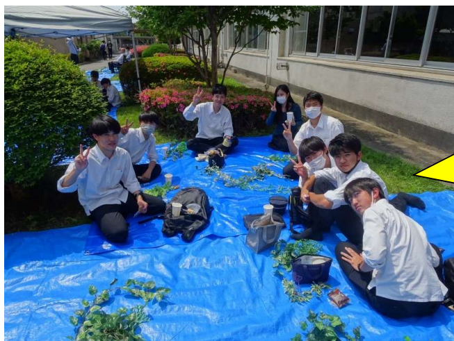
↑ 生徒や先生が交流→