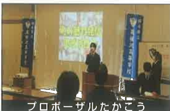
プロポーザルたかこう