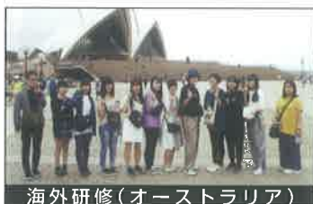
海外研修(オーストラリア)