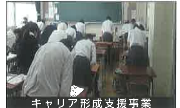
キャリア形成支援事業