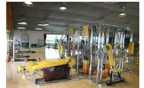
南体育館2Fのトレーニングルーム