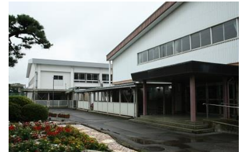
手前が北体育館、奥が南体育館

北体育館・南体育館 2つの体育館があり、南体育館2Fには、本格的なトレーニングルームがあります。