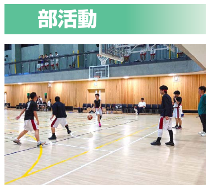
定通総体(男子バスケットボール部)