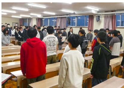
在校生と新入生対面式