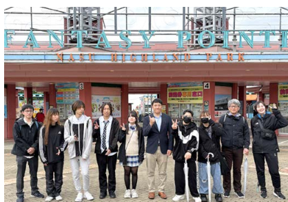
バス遠足(那須ハイランドパーク)