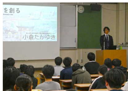
創立記念式典講演会