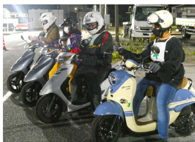
二輪車安全講習会